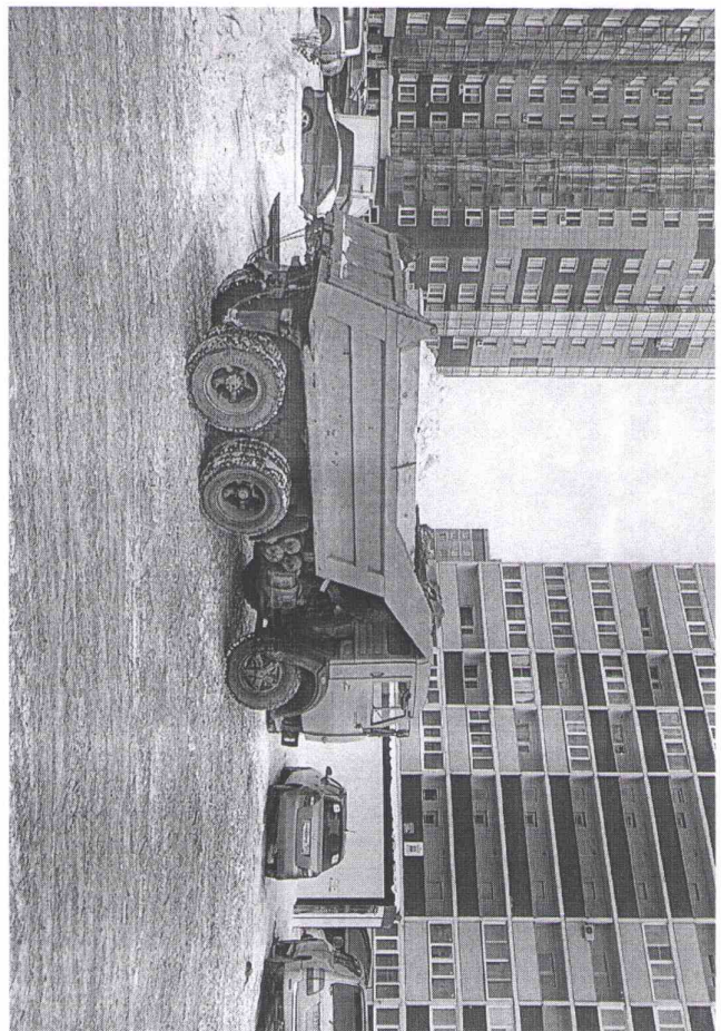
Мех. ударка снега пр. Дзержинская, 32а 02.02.2024г.