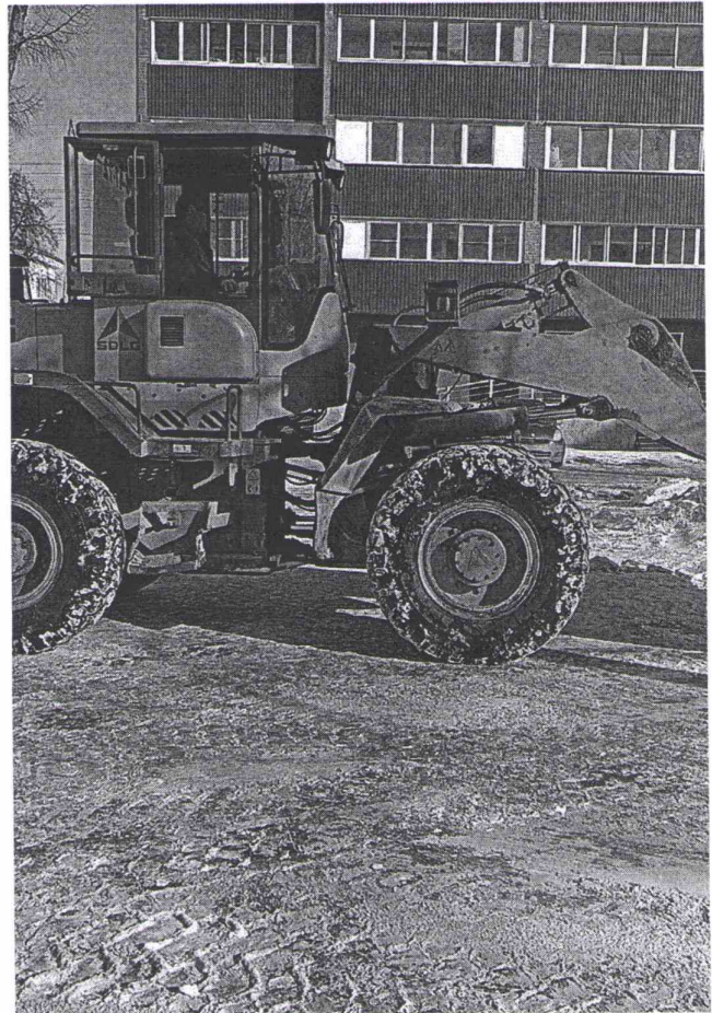
Механизированная уборка снега силами МКО №1011 по ул. Республиканская 21.02.2025г