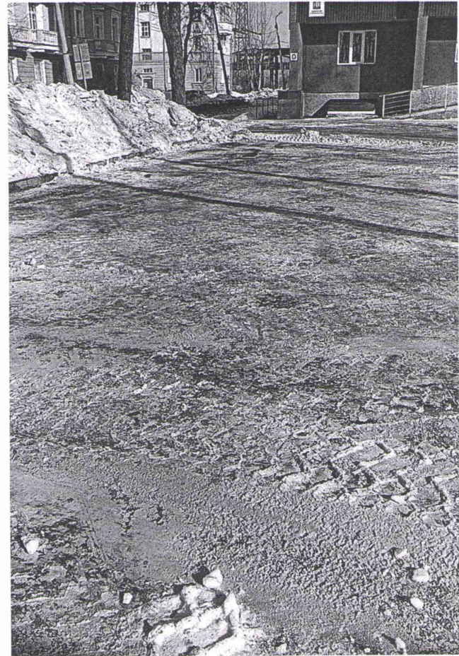
Механизированная уборка снега КМД №10/1 по Ул. Республикалская 21.02.2025г