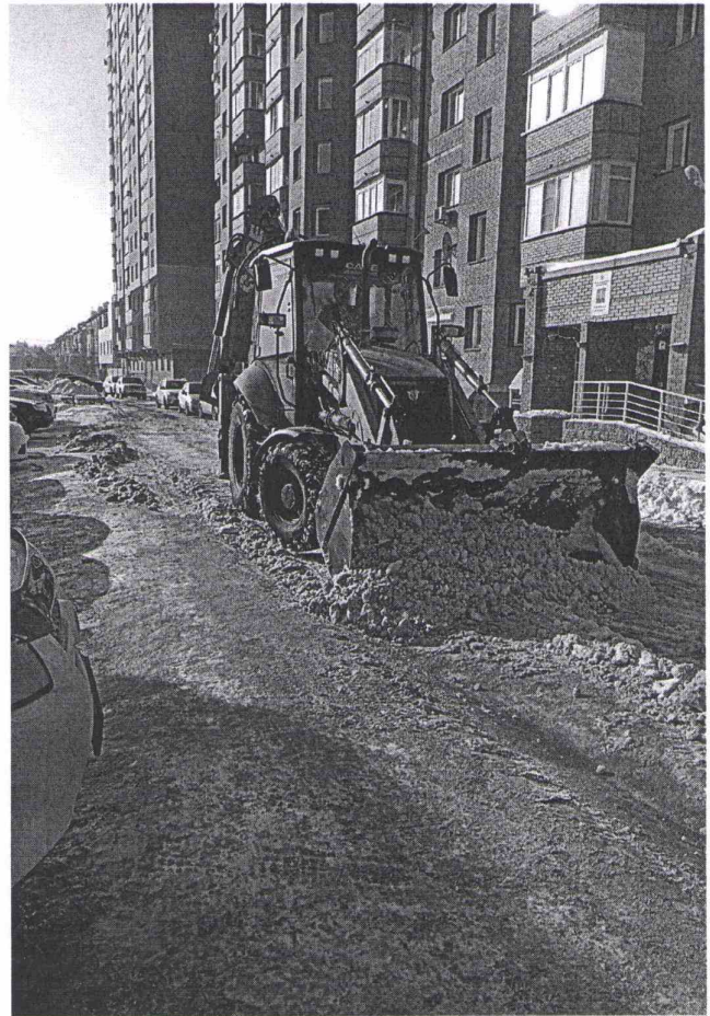
Механизированная уборка снега МКД №52 по ул. Народная 19.02.2025г.