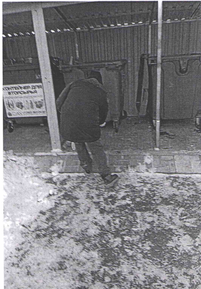
Дерагизацисо кафејетерисо и коизагки МКД N 65 10 ул. Непраседа 24.02.2025г.